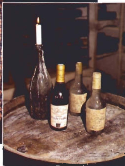
« Pour le vin de paille, il faut du soin et de l'amour ».